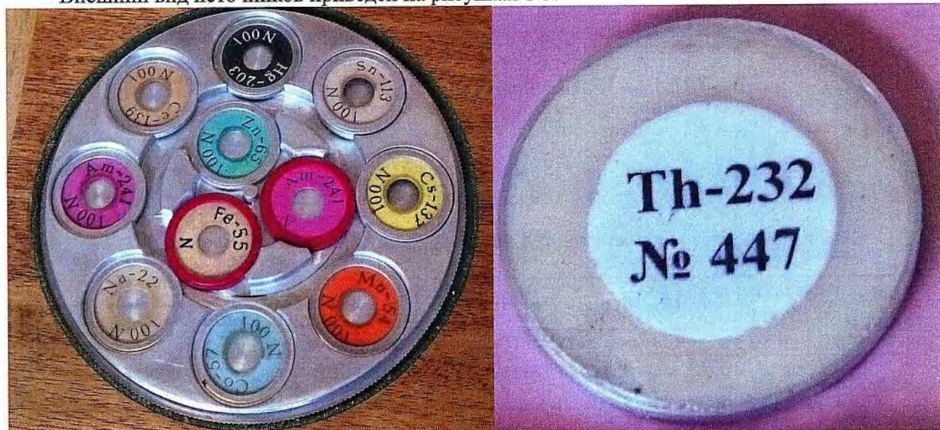
Рисунок 1 – Внешний вид источников ИМН-Г-1 и ИМН-Г-3-Т

Внешний вид источников приведен на рисунках 1-3.