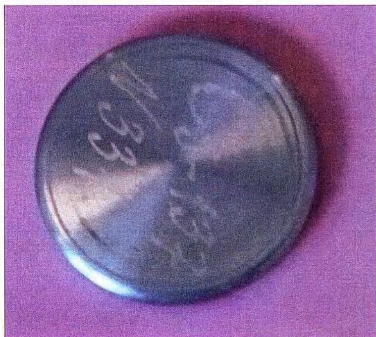
Рисунок 3 – Внешний вид источников ИВГИ и ИМН-Г-3-Т